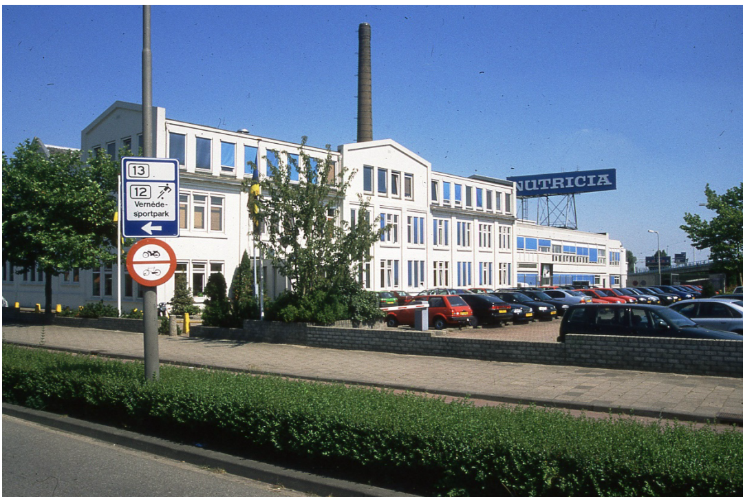
Het hoofdkantoor van Nutricia aan de Eerste Stationsstraat nr. 186, Wieringen, C.A.L. van (Cor) 1990 – uit de beeldbank van HGOS