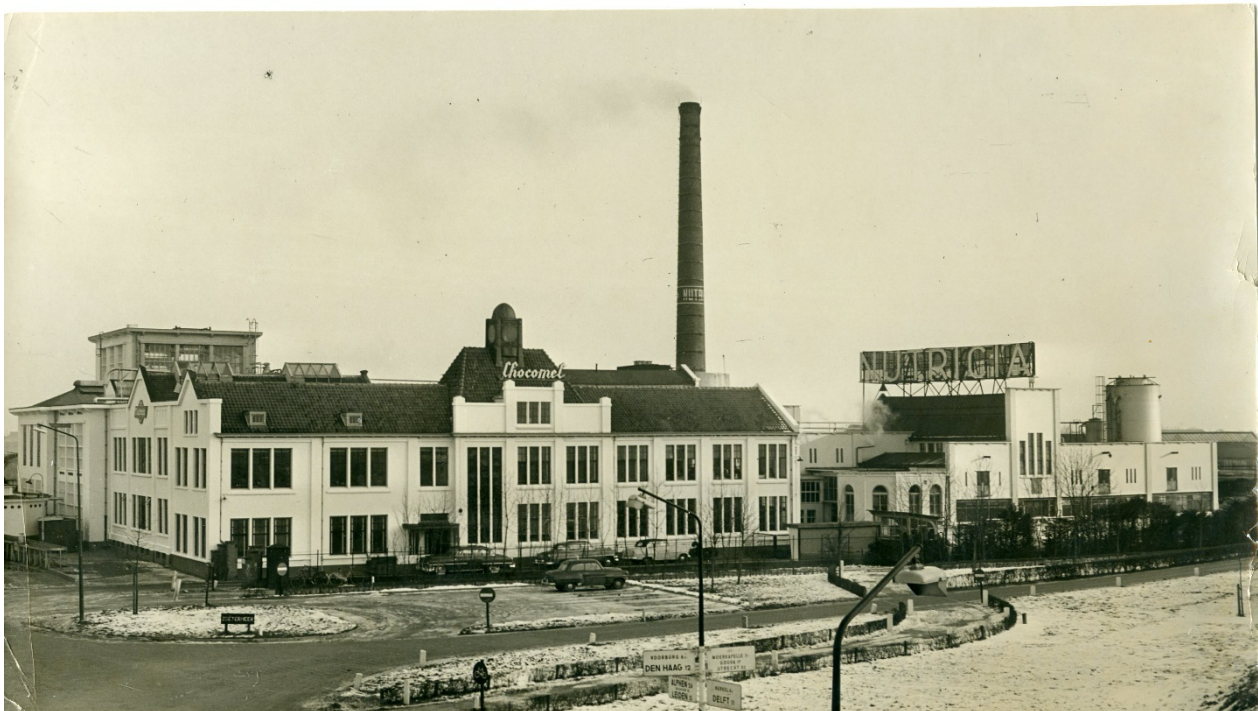
Fabriekscomplex van Nutricia aan de Stationsstraat nr. 186, Thuring Fotobureau ±1955 - uit de beeldbank van HGOS

De fabriek werd gebouwd aan de Stationsstraat, waar Nutricia meer dan een eeuw een beeldbepalende plek innam.