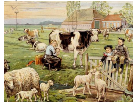
Lente in de weide