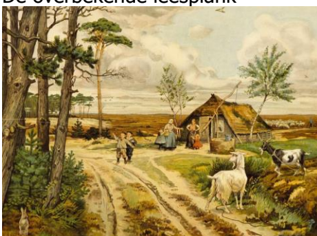
De heide in mei