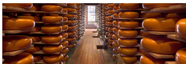
Reypenaer Kaaspakhuis in Woerden